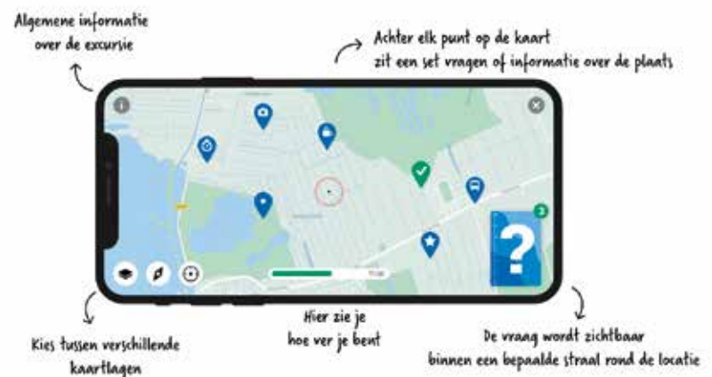
Figuur 3: De Peek-app.