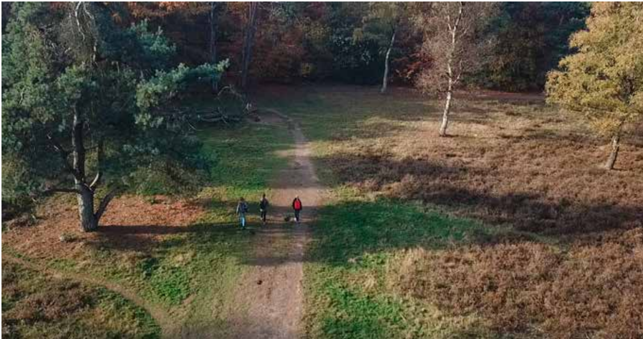
Zomer 2020: corona-proof het veld in met hulp van de PEEK-app, ontwikkeld door Wageningen Universiteit.